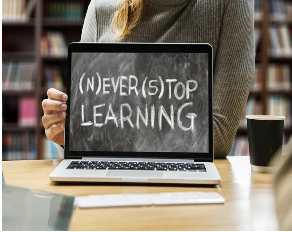
START Training Course